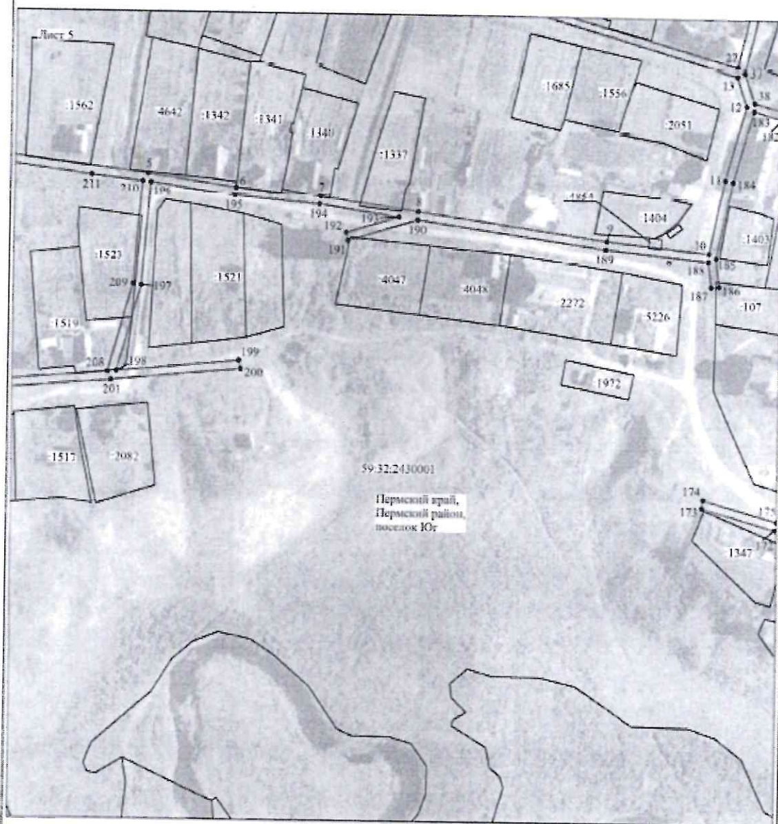
Схема расположения грани публичного сервитута объекта